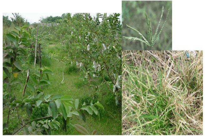
圖3. 抗嘉磷塞牛筋草之植株及於番石榴園之抗性族群。