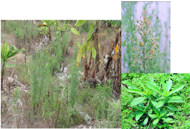
圖4. 抗嘉磷塞野苘蒿之植株及於香蕉園之抗性族群。