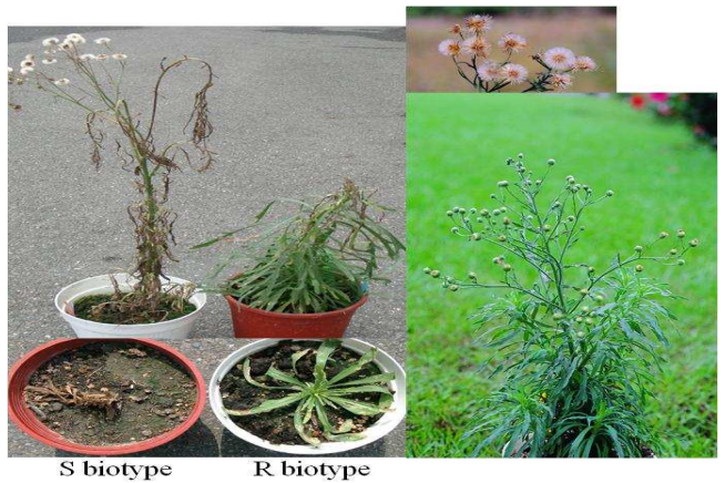
圖5. 抗嘉磷塞美洲假蓬之植物及施藥後之藥效比較。