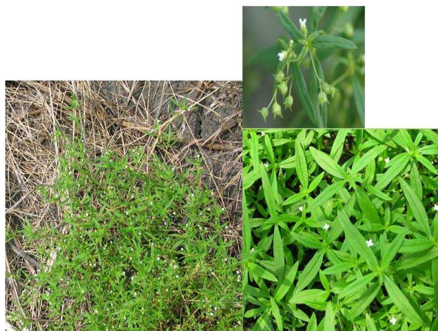
圖6. 抗嘉磷塞繖花龍吐株之植株及非耕地之抗性族群。