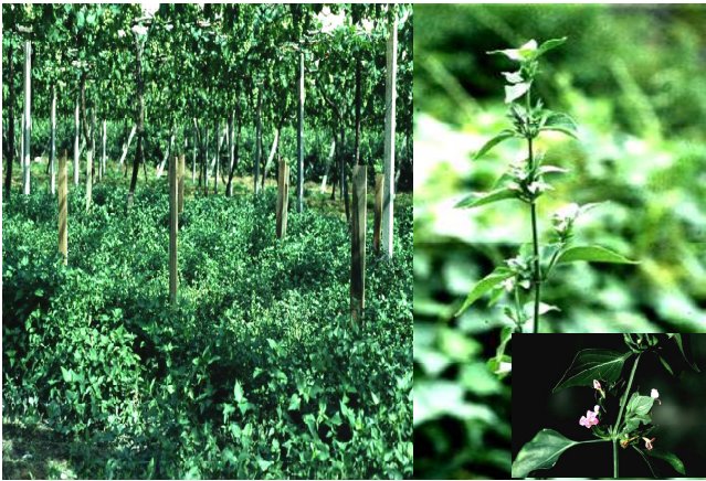
圖2. 耐嘉磷塞華九頭獅子草之植株及於葡萄園之抗性族群。