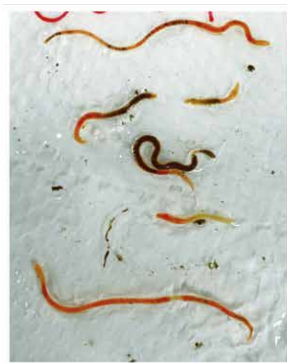
圖七、薩爾塔細帶蚓採集於花蓮富里區水稻 (慣行田)。