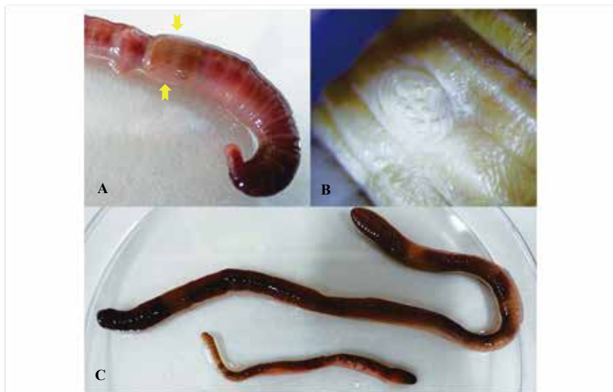
圖三、參狀遠環蚓 ( Amynthus aspergillum )。(A) 其雄孔一對位於體節第 18 節腹面外側；(B) 雄孔內側各有 3-5 顆乳突排成 2 橫列，其外有數圈環狀皺摺包圍 (酒精標本)；(C) 參狀遠環蚓成蚓與幼蚓。