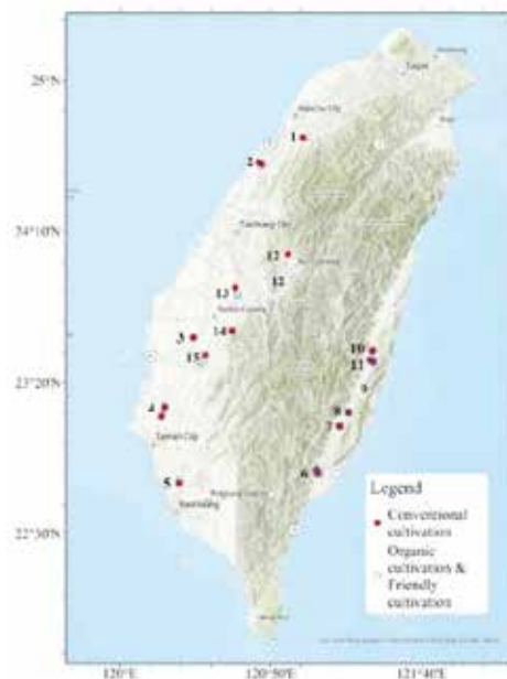
圖一、臺灣 15 個農業監測站之蚯蚓採樣點位置。（●表示慣行農法，□表示有機農法與友善農法，監測站代號：1.峨眉，2.西湖，3.溪口，4.麻豆，5.燕巢，6.卑南，7.池上，8.富里，9.長濱，10.瑞穗，11.玉里，12.埔里，13.名間，14.古坑，15.嘉義市）。

由 2006 年開始，農業試驗所結合各農業改良場進行農業生態系研究站設置，本研究於 2021 年開始進行蚯蚓多樣性調查工作，長期生態研究農業監測站（圖一）分別為（1）新竹峨眉區-桶柑（有機 4 區、慣行 4 區），（2）苗栗西湖區-文旦（有機 3 區、慣行 3 區），（3）嘉義溪口區-水稻（友善 3 區、慣行 6 區），（4）臺南麻豆區-文旦（有機 4 區、慣行 4 區），（5）高雄燕巢區-印度棗（有機 2 區、慣行 3 區），（6）臺東池上區-水稻（有機 3 區、慣行 4 區、友善 1 區），（7）臺東卑南區-番荔枝（有機 4 區、慣行 4 區），（8）花蓮富里區-水稻