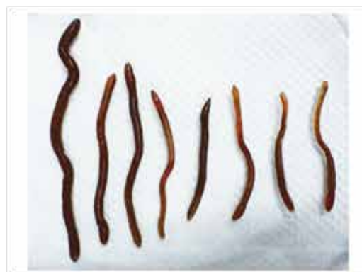
圖四、土後腔環蚓 ( Metaphire posthuma ) 成蚓與幼蚓，為慣行田與有機田優勢種。