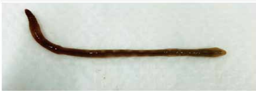
圖六、臺灣特有種-福爾摩沙腔環蚓採集於苗栗西湖區文旦 (有機田)。

Fig. 5. Pontoscolex corethrurus . (A) Characteristics: thin and long prostomium, and three pairs of calciferous glands in front of clitellum; (B) cocoons of Pontoscolex corethrurus .