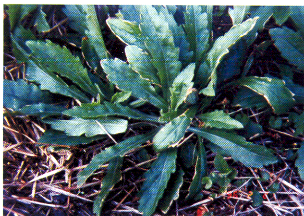
圖二 磁磚場西南側受害茶園區內野塘蒿葉片出現輕微葉緣枯褐徵狀

Fig. 2. The marginal leaf necrosis injury symptom of Conyza sumatrensis (Retz.) Walker in south-western tea plantation of the ceramics factory.