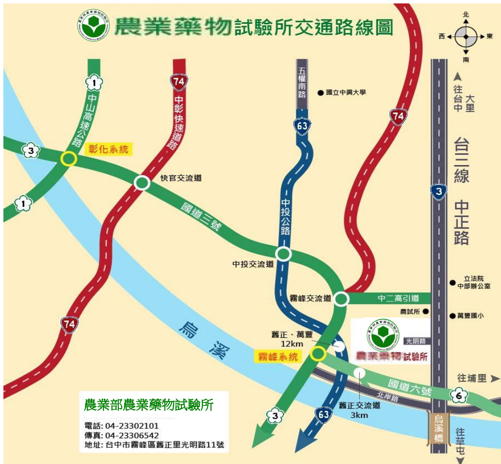
農業部農業藥物試驗所交通位置圖