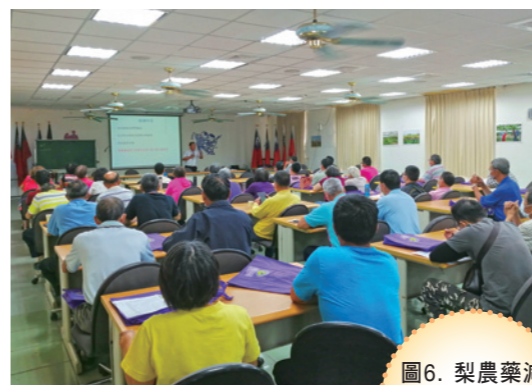
圖6. 梨農藥減量與健康管理技術講習會

5)，分享梨栽培管理經驗及如何農藥減量節省成本。一一〇年及一一一年分別於苗栗縣卓蘭鎮農會、三灣鄉農會及臺中市東勢區農會、新社區農會、后里區農會進行「梨農藥減量與健康管理技術講習會」(圖 6)，針對梨栽培上的病蟲害發生與防治、肥培管理、性費洛蒙之設置技巧、用藥時機、農藥特性與輪用技巧及農藥減量方法等，提供專業技術講解，推廣梨栽培之健康管理技術及農藥減量觀念，以上參加人數共達 375 人。