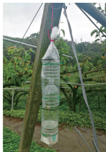
→圖4. 三層式保特瓶誘蟲盒