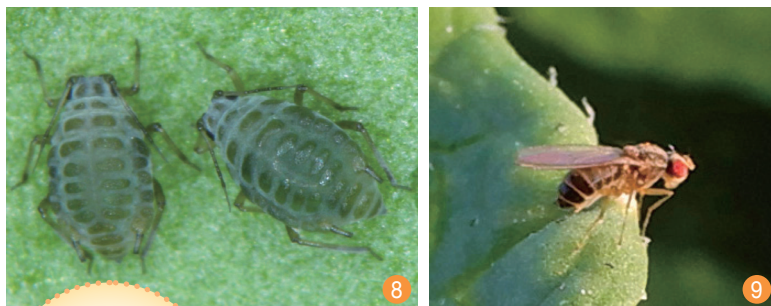
圖說：8. 蚜蟲類 9. 斑潛蠅

2~4 齡若蟲固著刺吸取食直至羽化為成蟲，若蟲期即漸漸在表面分泌臘粉並覆蓋表面。成蟲及若蟲群集於葉背吸食植株營養液，並可分泌蜜露，誘引螞蟻或其他昆蟲及誘發煤煙病，影響光合作用。全年發生，雜食性，完成一世代夏季僅需 19~27 日，冬季約 30~60 日。