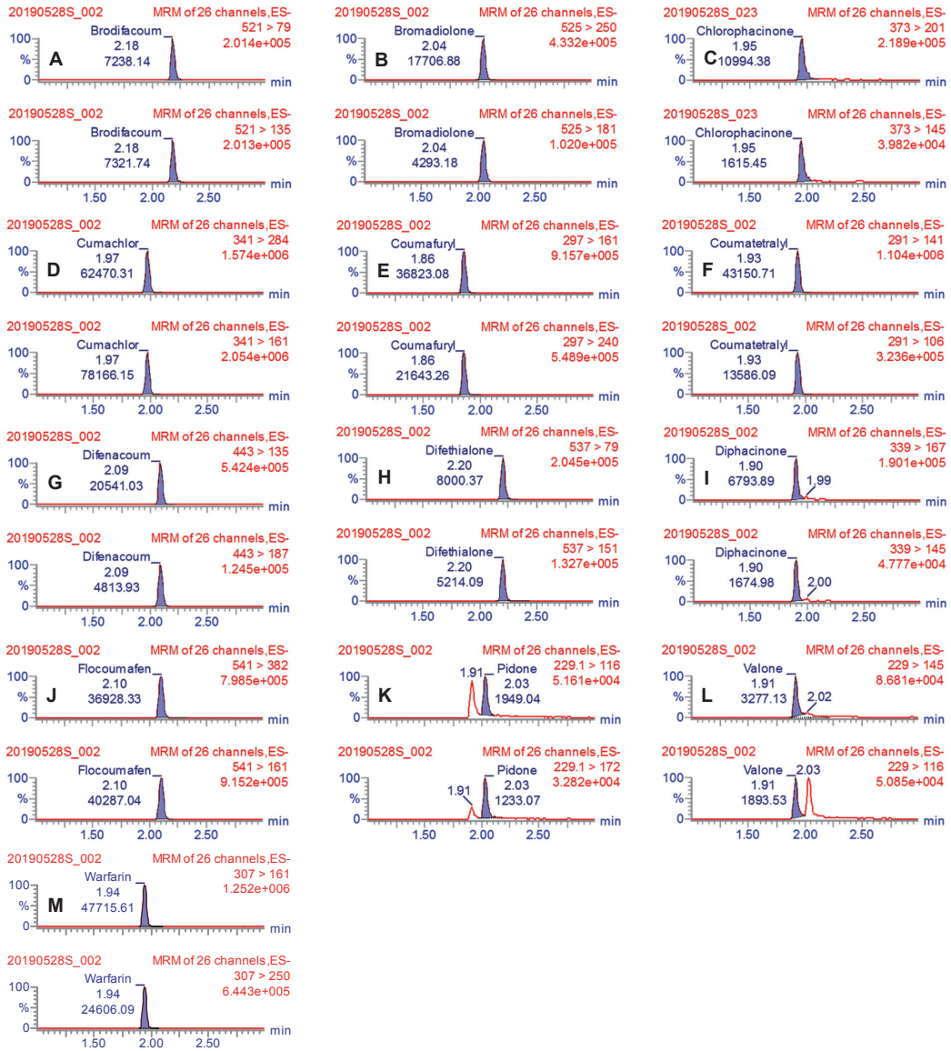
圖二、13 項抗凝血殺鼠劑 0.05 µg/mL 之 MRM 圖譜。(A) 可滅鼠、(B) 撲滅鼠、(C) 可伐鼠、(D) coumachlor、(E) coumafuryl、(F) 剋滅鼠、(G) 雙滅鼠、(H) 達滅鼠、(I) 得伐鼠、(J) 伏滅鼠、(K) pidone、(L) valone 和 (M) 殺鼠靈。