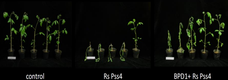
figure 4. in vivo Ba-BPD1 against R. solanacearum Pss4 in tomato cv. 聖女.