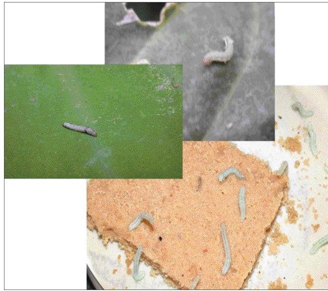
甜菜夜蛾（上） 斜紋夜蛾（中） 和擬尺蠖（下） 的幼蟲。