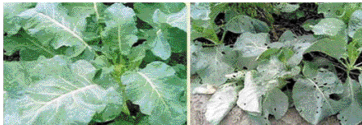
甘藍夜蛾核多角體病毒對於甘藍夜蛾的防治效果相當良好，左圖是進行防治試驗組，右圖是未進行防治對照組。