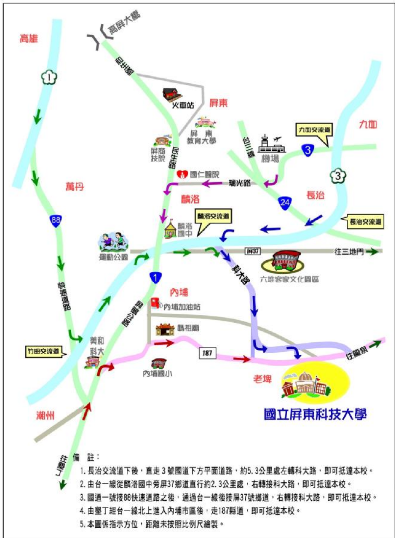
國立屏東科技大學位置示意圖