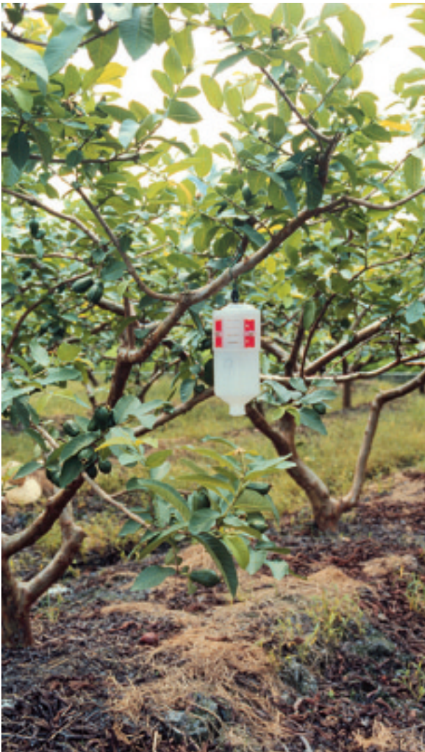
圖 2. 果實蠅誘集器

蟲害及果實蠅等作物之週年調查系統，已經累積了許多經驗。民國 86 年台灣省政府農林廳為能充份掌握國內重要疫病蟲害之發生情況，並因應國外農產品進口帶來之新興疫病蟲害入侵問題，由廳長召集植物保護科及廳屬單位首長，就建立一套有效的疫情通報管理系統進行多次研商。依當時廳屬試驗場所轄區及機關內之植物保護人員之總合人力之實際狀況，以及過去在水稻、雜糧病害及果實蠅等監測體系之經驗，研判應以成立地區植物疫情監測中心為首要之務，以求能及時獲取全省疫情之第一手資訊。