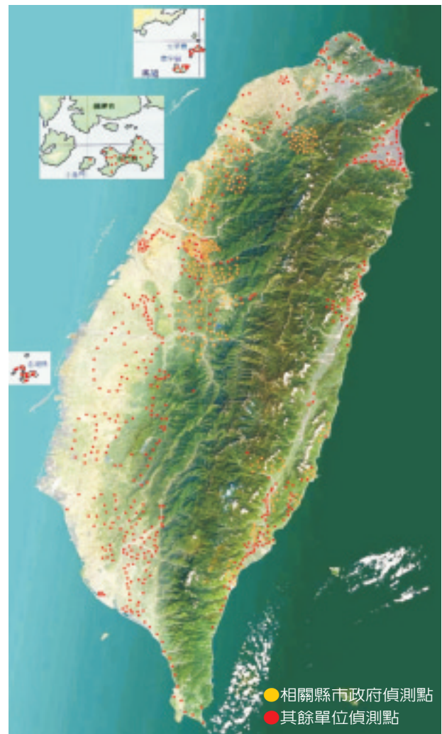
圖 1. 民國 93 年台、澎、金、馬地區偵測點分布圖

加強進口檢疫，防堵檢疫有害生物進入國內，以保護本地農業生產環境，一直是動植物防疫檢疫局的重要工作。但是根據世界各國長期以往之經驗，再嚴格的檢疫把關，仍然無法完全杜絕外來有害生物入侵。以美國為例，有人估計，如果在各檢疫關口的害蟲檢出率為80%，則每年將有600批次的外