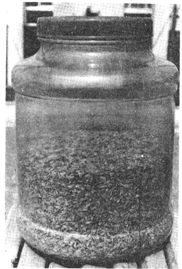
圖二、填滿穀殼和樣品之 5 升裝塑膠瓶

隨後將樣品取出，檢視並計數每一樣品中棲集之蟲數。將挑除蟲隻之稻穀分別置於口徑 4.5 公分高 7.5 公分之塑膠瓶內，蓋好瓶蓋，每日計數新羽