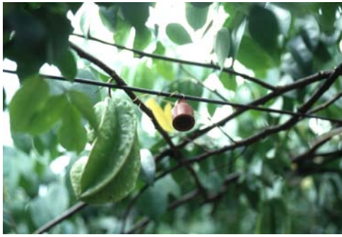
利用交配干擾法防治花姬捲葉蛾