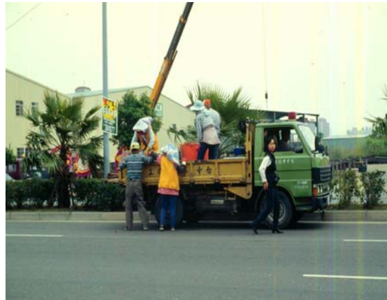
利用黑殭菌防治華盛頓椒子紅胸葉蟲