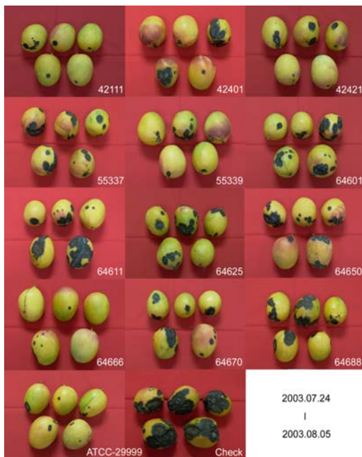
由土壤中篩選之芽孢桿菌防治芒果炭疽病之效果