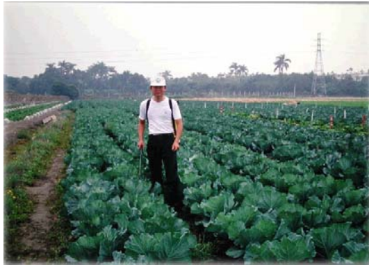
蘇力菌在田間之應用

針對國內重要害蟲，開發性費洛蒙合成技術，改善製劑配方、設計有效誘蟲器，建立田間使用技術。