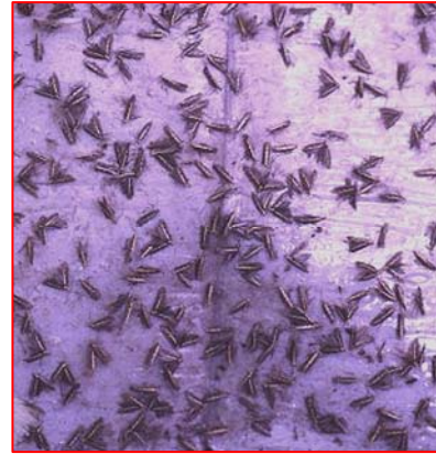
以性費洛蒙大量誘殺小菜蛾